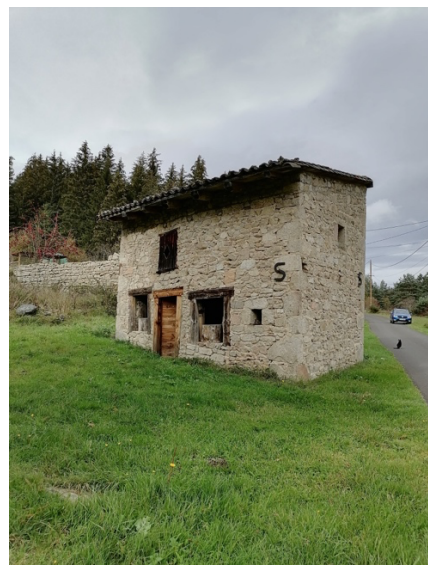
Le four a pain au FORESTIER