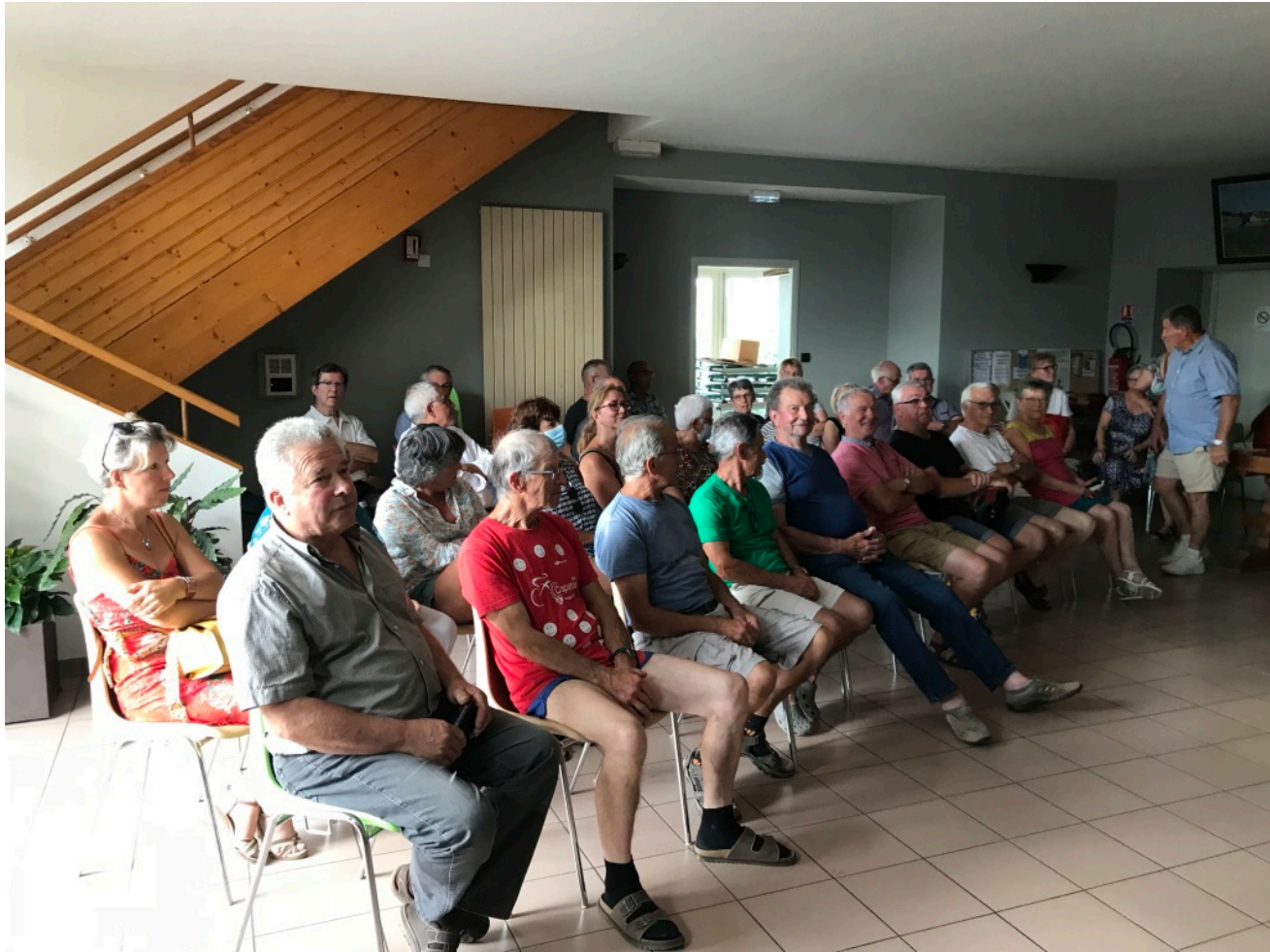
Photo de la réunion du 22 juillet 2022

Début 2023 des fiches de travaux seront élaborées. Elles permettront de projeter des travaux de bourg sur plusieurs années.